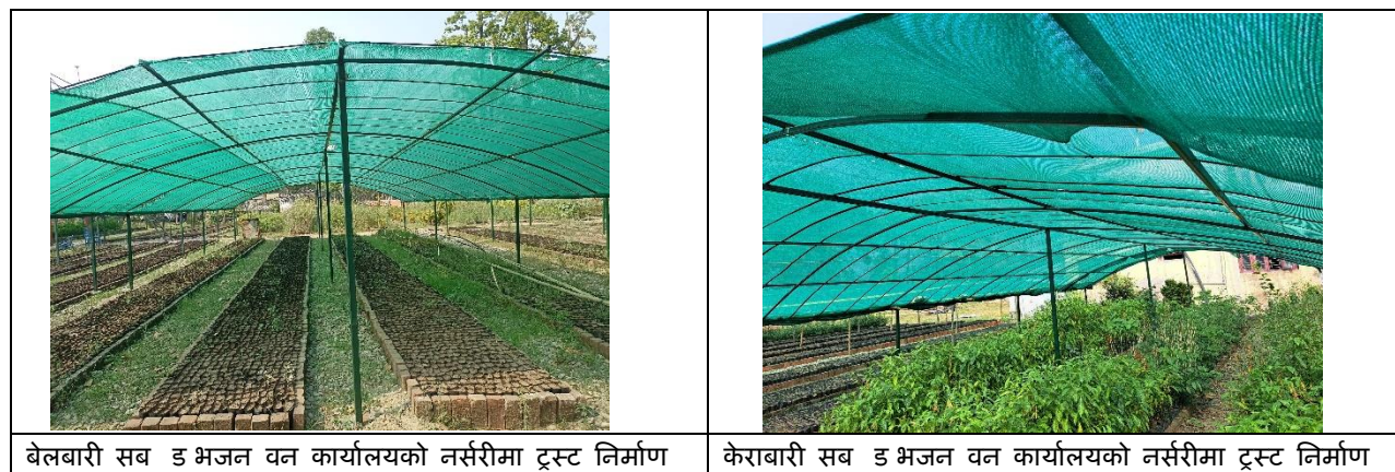
बेलबारी सब डिभिजन वन कार्यालयको नर्सरीमा ट्रस्ट निर्माण

यस अवधिमा यस जिल्लामा बेलबारी र केराबारी सब डिभिजन वन कार्यालयको कम्पाउण्डमा रहेको नर्सरीमा ट्रस्ट निर्माणको कार्य सम्पन्न भएको छ ।